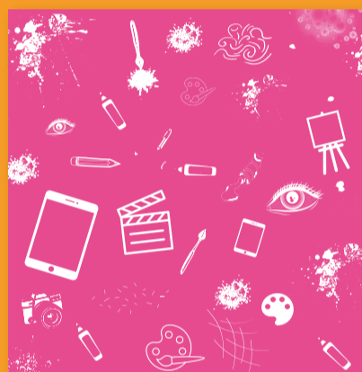
Artes. Artes Visuales