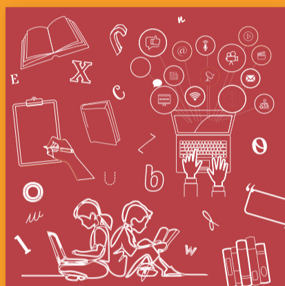
Lengua y Literatura