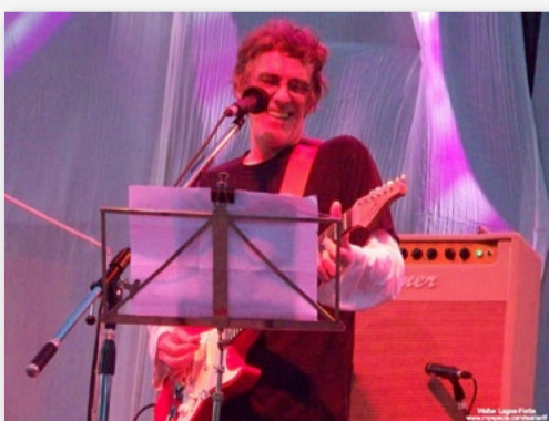
Luis Alberto Spinetta.