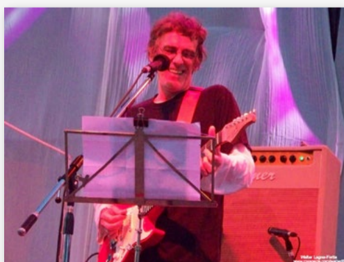
Luis Alberto Spinetta.