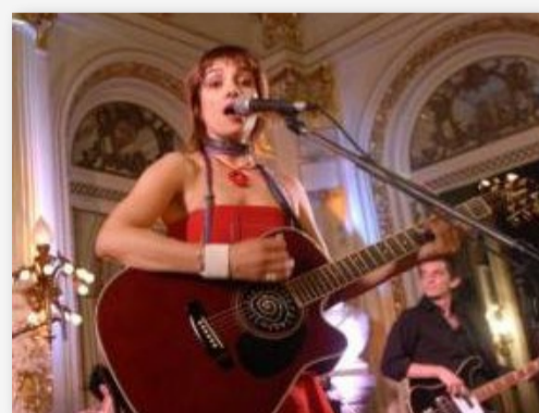
Hilda Lizarazu en concierto en la Casa Rosada.