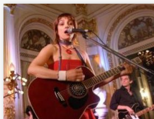
Hilda Lizarazu en concierto en la Casa Rosada.