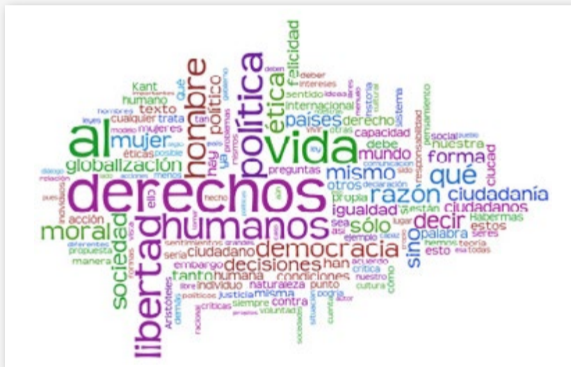
Ejemplo de nube de tags.