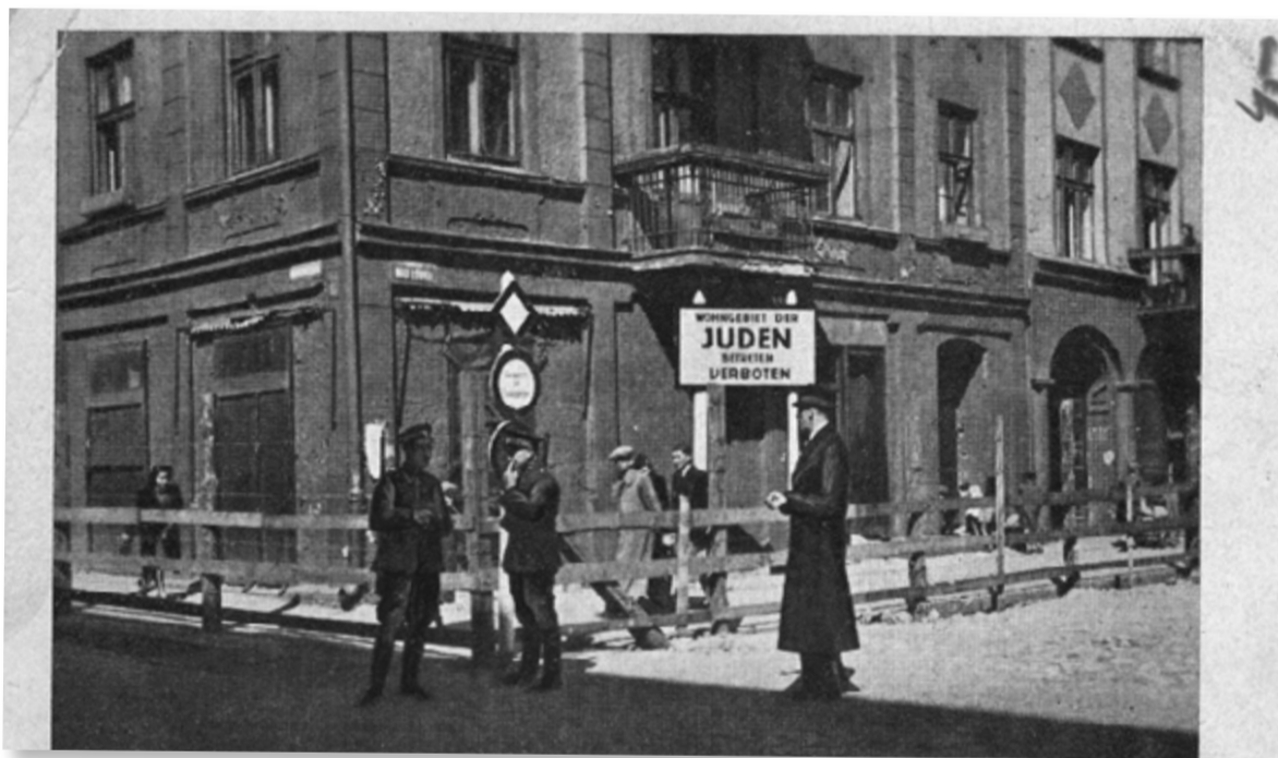
Imagen 4. Límite perimetral del gueto de Lodz, Polonia.