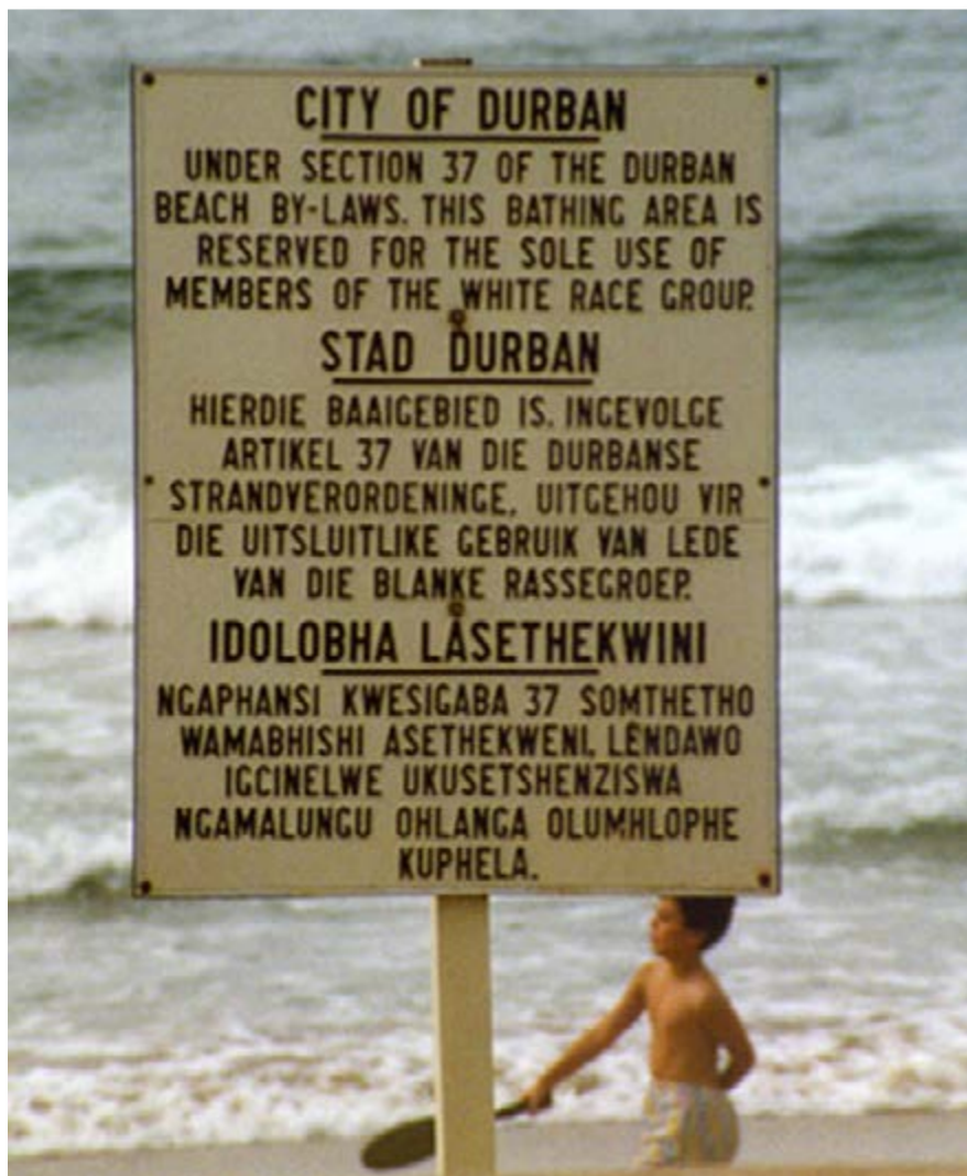
Imagen 2. “En Durban se declara que la playa es solo para blancos según la ley de la sección 37 de los estatutos de Durban”.