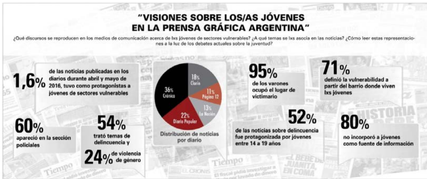
Informe: Visiones sobre los jóvenes de sectores vulnerables en los medios gráficos argentinos. Crisol. Proyectos Sociales, abril-mayo de 2016, p. 12.

“Hablamos de estigmas cuando se conjugan cinco componentes, etiquetar, estereotipar, separar, pérdida de estatus y discriminación en el marco de una relación de poder. El mecanismo consiste en etiquetar a partir de determinadas características negativas a un grupo creando una separación imaginaria o real entre ‘nosotros’ y ‘ellos’, de modo tal que les acarrea una pérdida de estatus social y una discriminación con múltiples manifestaciones. De esta forma, la estigmatización produce o profundiza situaciones de exclusión previas...” (Kessler, 2012.)