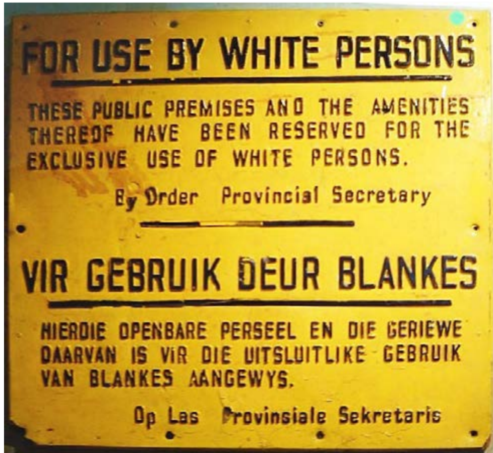
Imagen 1. “Estos locales públicos y sus servicios están reservados exclusivamente para uso de personas blancas. Orden de la Secretaría Provincial”.