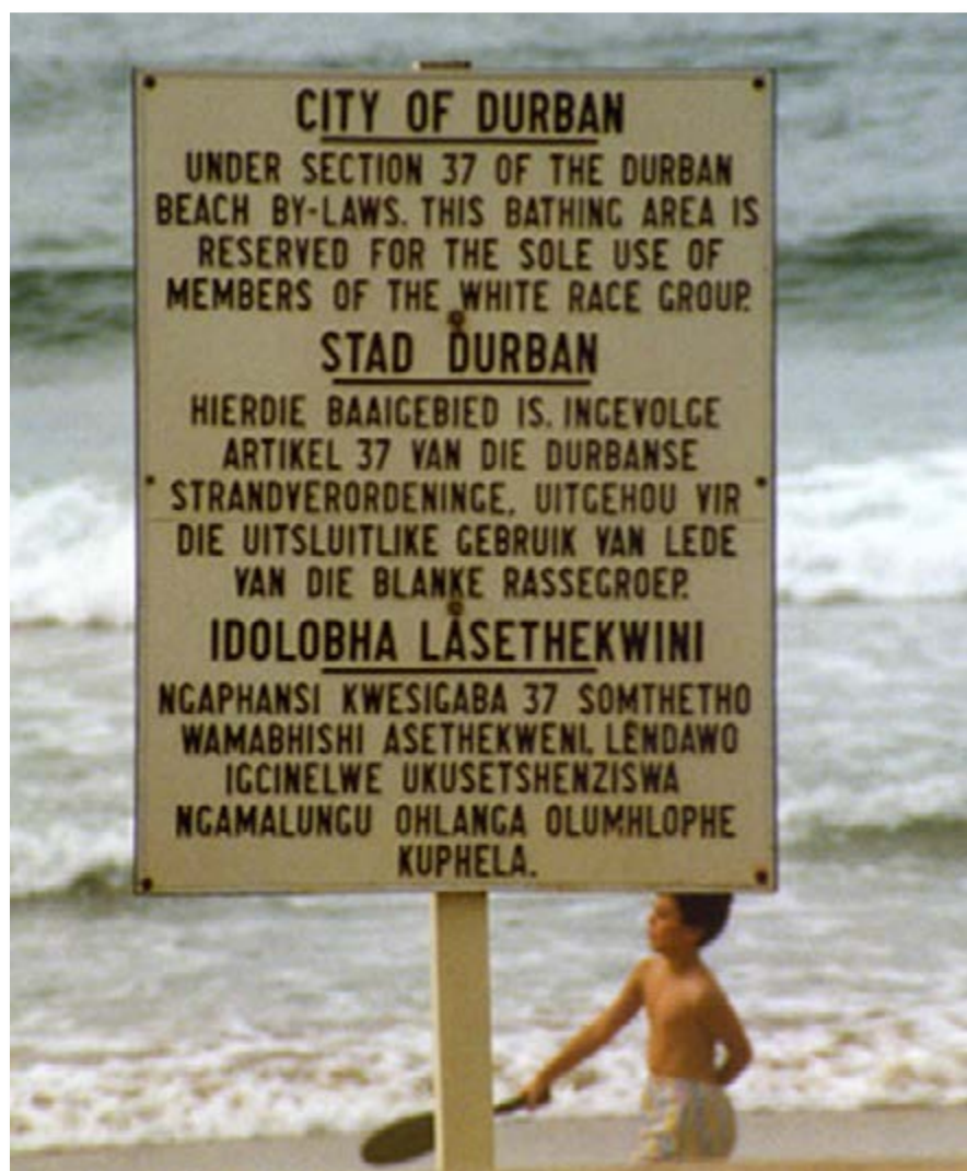
Imagen 2. “En Durban se declara que la playa es solo para blancos según la ley de la sección 37 de los estatutos de Durban”.