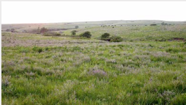
Ambiente de pradera o pastizal.