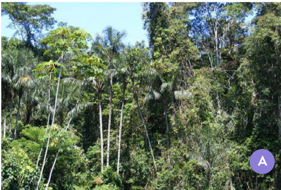
Selva amazónica en Brasil.

Observá las siguientes imágenes y luego respondé las preguntas que se presentan a continuación.