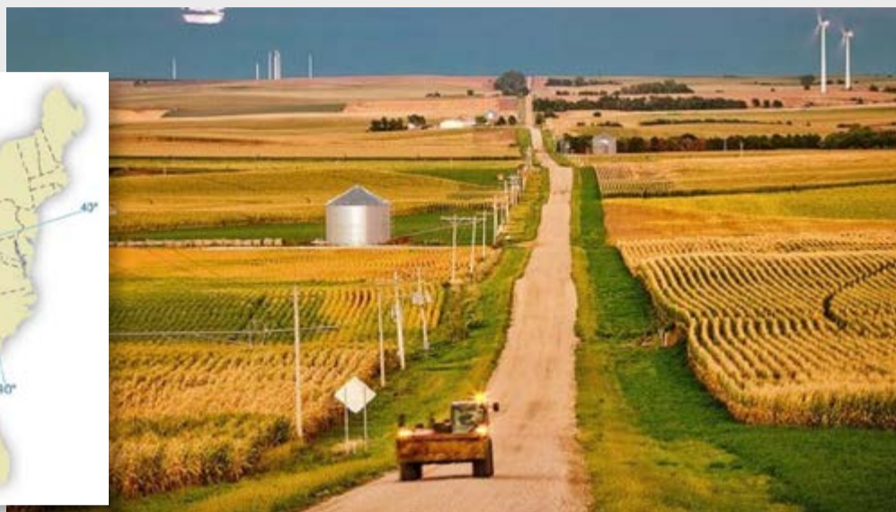
Paisaje de Nebraska con turbinas eólicas.

A partir del siglo XIX, el gobierno de Estados Unidos comenzó la venta de las tierras de las grandes llanuras a muy bajo precio, esto incentivó el establecimiento de numerosos colonos que comenzaron a practicar la agricultura y la ganadería. La llegada del ferrocarril favoreció la conexión con los puertos costeros y una expansión de la ocupación del territorio hacia el oeste, donde el clima es menos lluvioso y los suelos menos fértiles. Debido a esto, la agricultura se expandió sobre las tierras fértiles y desplazó a la ganadería hacia las tierras menos favorables.