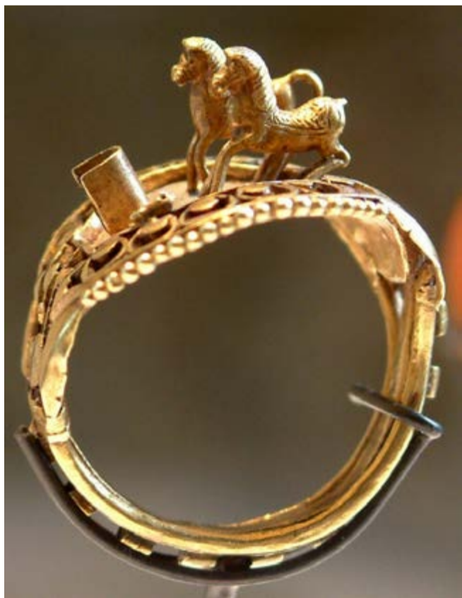
Alhaja de oro. Museo del Louvre.