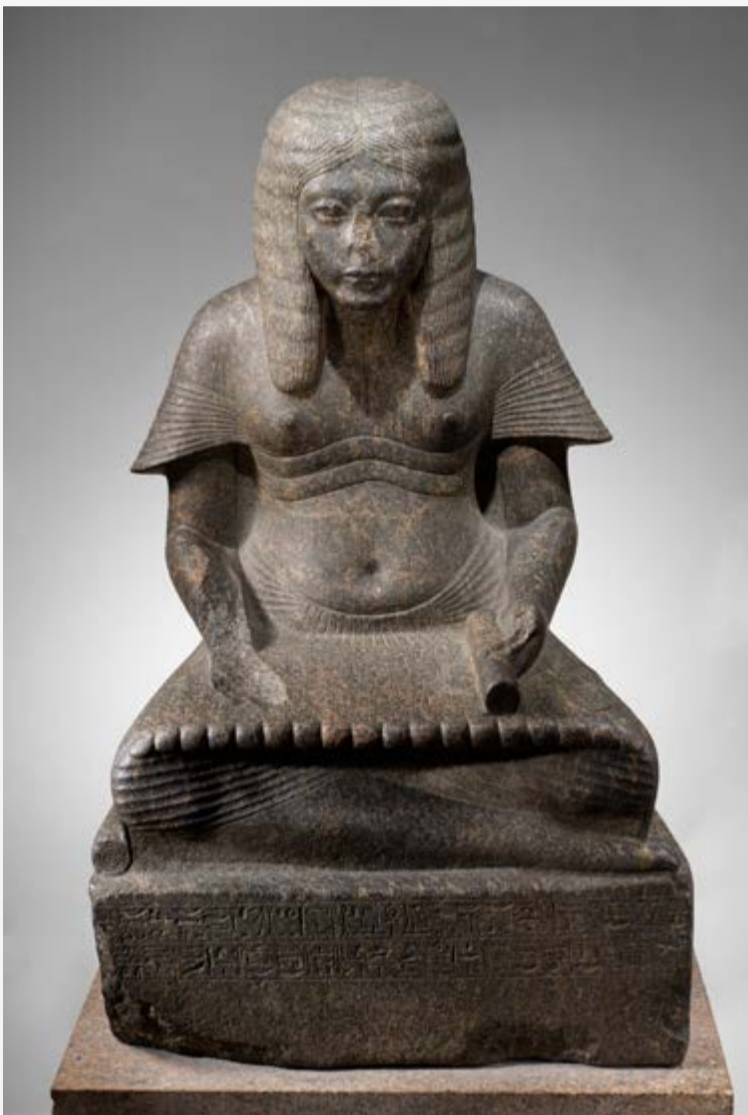
Estatua de Horemheb. Fue un cortesano culto y un célebre militar durante el reinado de Tutankamón.

con el calor de los hornos, los tejedores tenían posiciones que les producían calambres musculares. A diferencia de estos, los escribas llegaban a tener autoridad, vivían del tesoro público, estaban eximidos de pagar impuestos y del servicio obligatorio en las épocas de crecidas del Nilo. Los más capacitados podían acceder a cargos muy altos. Por ejemplo, Horemheb llegó a ser faraón e Imhotep llegó a ser considerado un Dios, caracterizado por ser muy inteligente, fue sacerdote del Dios-Sol y el autor de los planos de la primera pirámide de Sakkarah. En las imágenes los vemos desarrollando papiros: