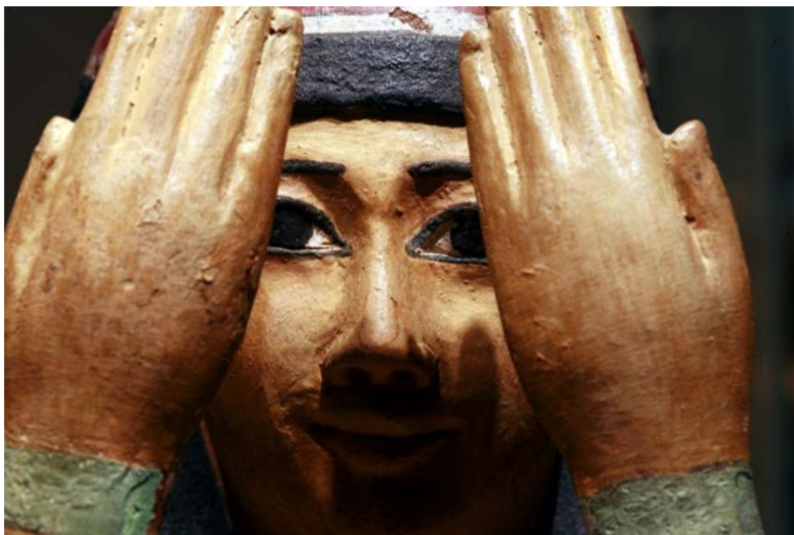
La diosa Isis, estatua Museo del Louvre.