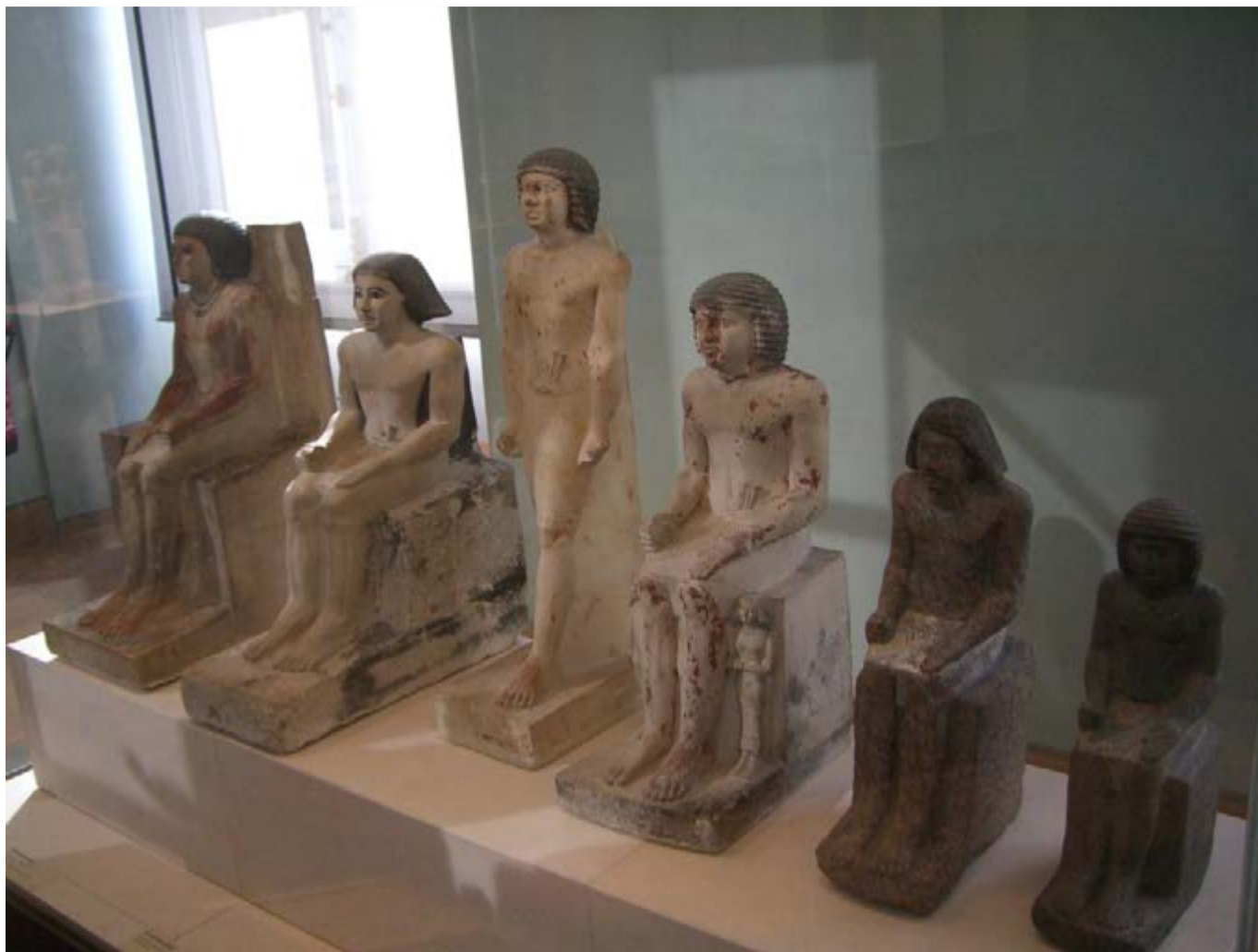
Estatuillas de funcionarios egipcios. Museo del Louvre.