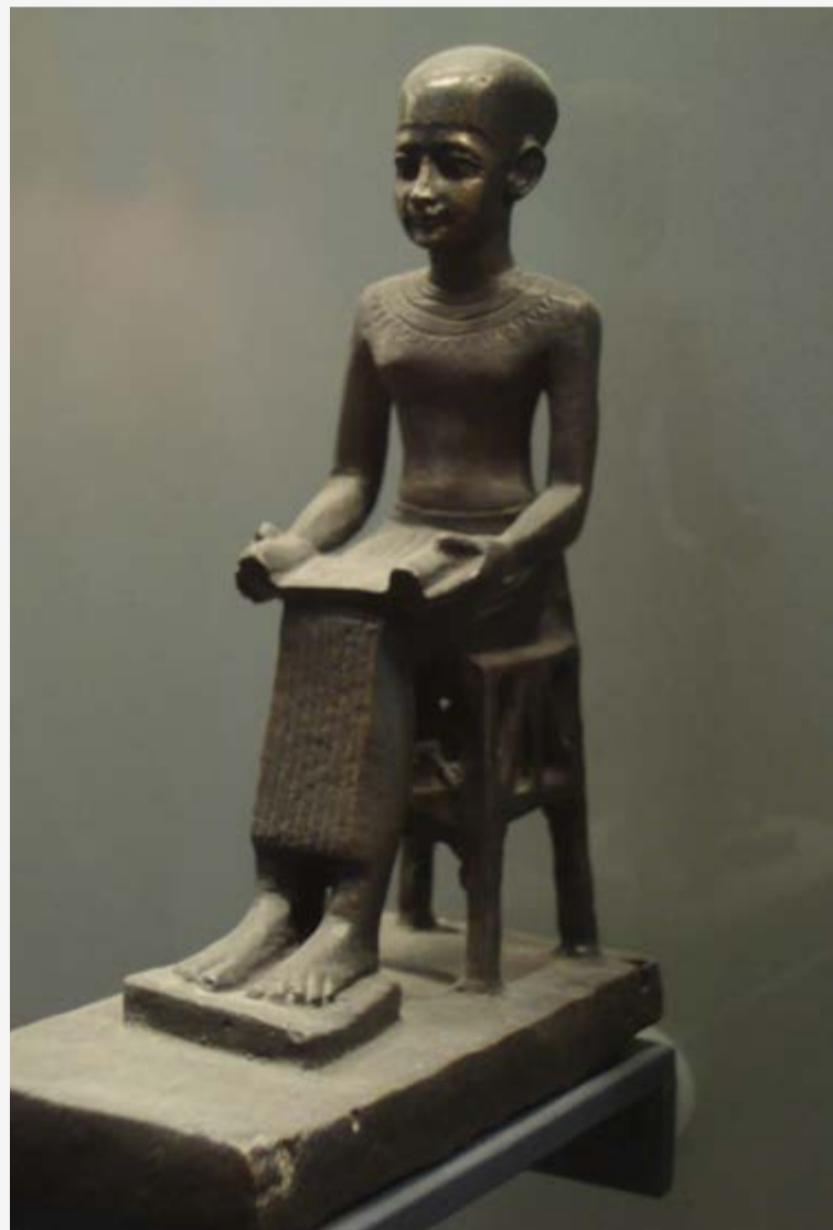
Estatua de Imhotep, "el que viene en paz", en el Museo del Louvre. Fue sabio, médico, astrónomo y el primer arquitecto conocido de la historia.