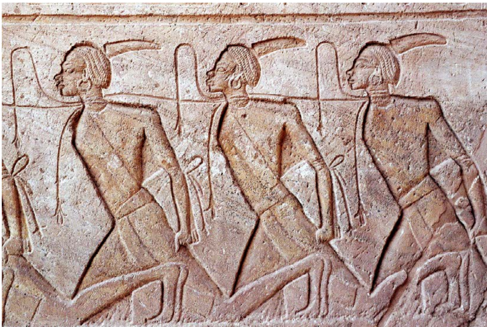
Prisioneros Nubios. Detalle Templo de Abu Simbel.