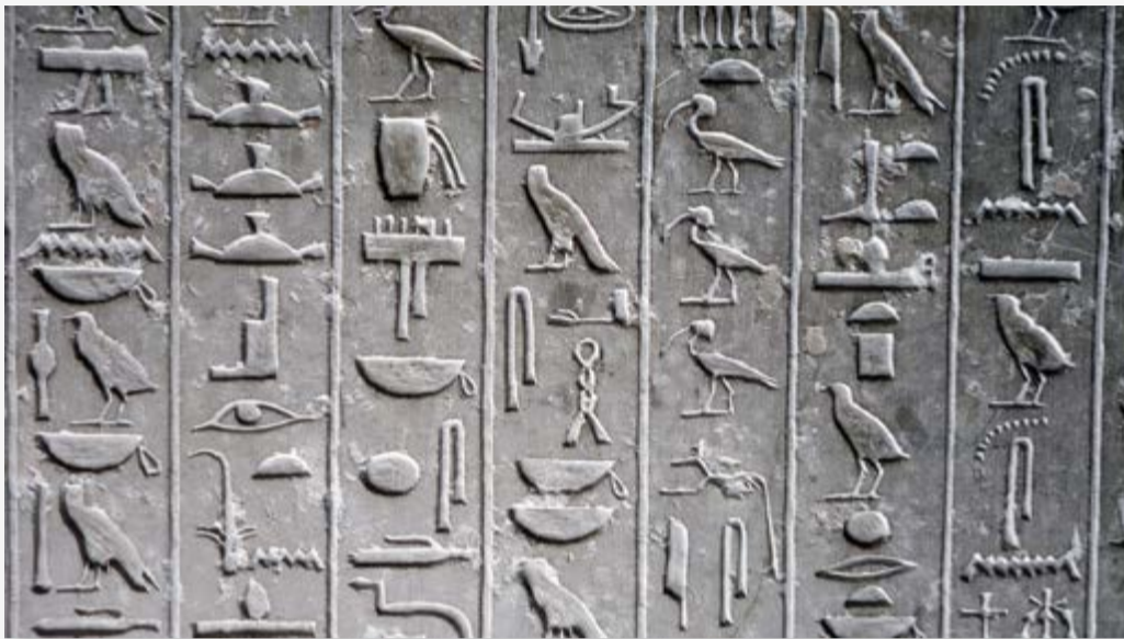
Pictogramas en bajo relieve en una tumba en Saqqarah.