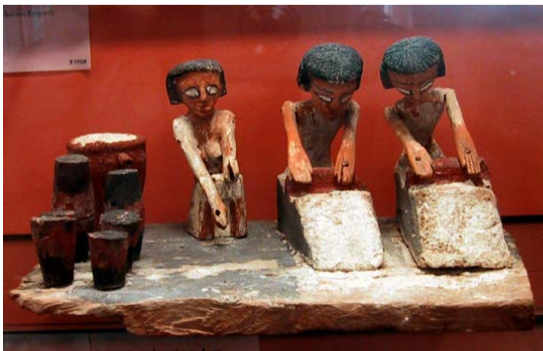
Moliendo el grano para fabricar cerveza.