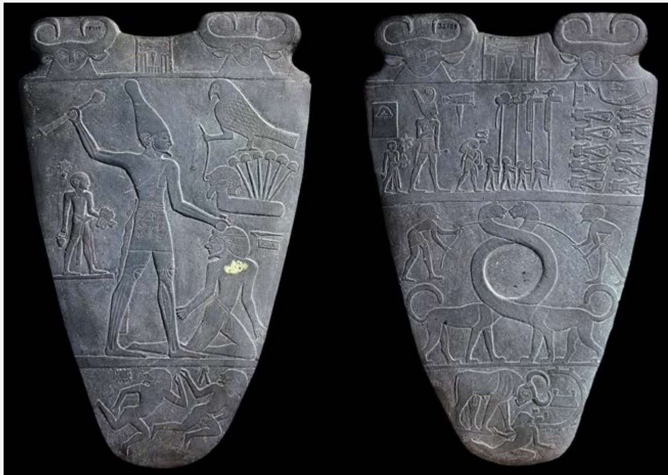
Paleta de Narmer. Encontrada en el sitio Arqueológico de Hieracópolis (Nejen), actualmente en el Museo Egipcio de El Cairo. Realizada en pizarra de 63 cm de altura. En las dos caras se registró pictográficamente la unificación de las jefaturas del Alto y el Bajo Egipto, alrededor del año 3000 a. C.