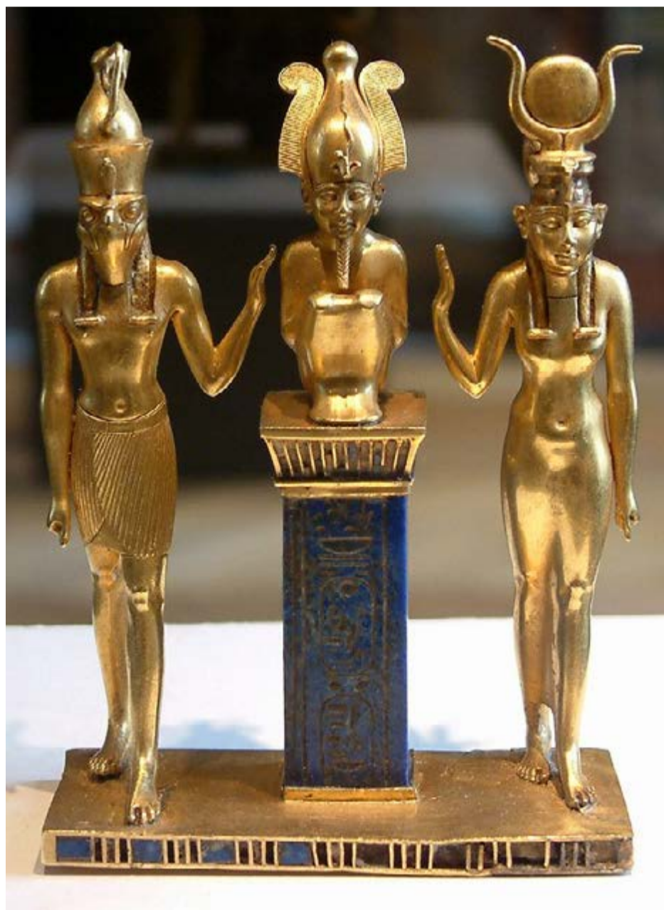
Estatuillas de oro Museo del Louvre.