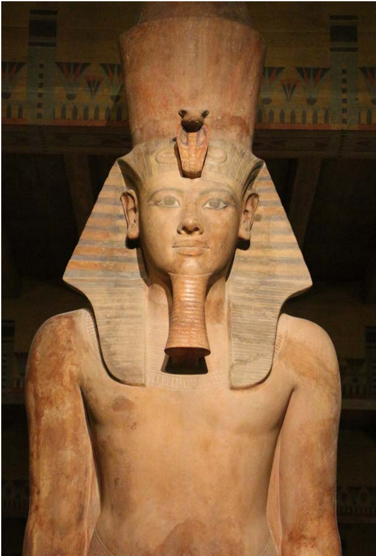
Estatua de Tutankamón en el Palacio de Luxo.