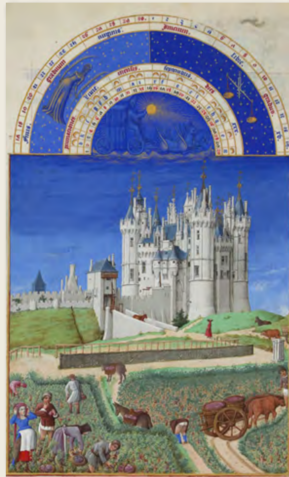
Un día en la vida de los campesinos en la Edad Media, según las ilustraciones del duque de Berry.

En la escala inferior, se encuentran los campesinos que trabajan la tierra con sus propios instrumentos de trabajo. La mayoría está en ella en calidad de siervos y, por lo tanto, no pueden abandonarla. Los dueños de la tierra son los señores y otorgan parcelas a las familias campesinas para procurarse el sustento con el trabajo de estas. El señor exige al campesino el pago de rentas que pueden ser: a) en trabajo: obligación del campesino de trabajar las tierras que el señor se queda para sí y hacer todo tipo de trabajos; b) en especie: obligación del campesino de entregar cada año determinada cantidad de lo