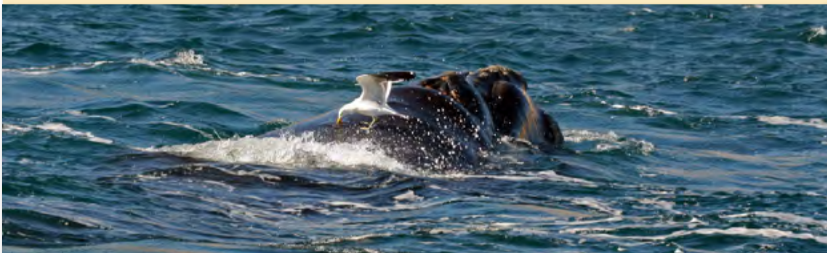
Una gaviota cocinera picotea el lomo de una ballena franca austral.

Alrededor de Puerto Madryn se han verificado basurales a cielo abierto, lo que permite que muchos animales tengan alimento disponible. Los ataques de gaviotas a las ballenas, que visitan estas aguas tranquilas para reproducirse, parecen haber aumentado afectando negativamente la calidad de vida de las ballenas en esta área de cría.