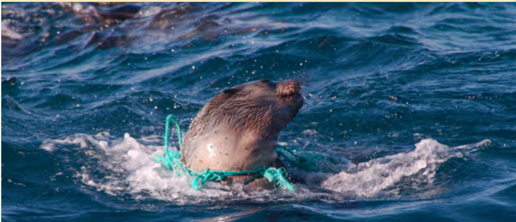
Lobo marino con un suncho de plástico alrededor.

El plástico es un material barato y liviano que tiene muchos usos. Los océanos están llenos de plásticos, el 80% de los residuos que encontramos en el mar son residuos terrestres y no marinos.