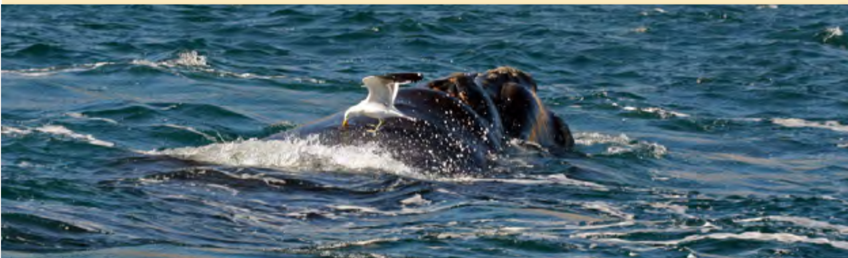
Una gaviota cocinera picotea el lomo de una ballena franca austral.

Alrededor de Puerto Madryn se han verificado basurales a cielo abierto, lo que permite que muchos animales tengan alimento disponible. Los ataques de gaviotas a las ballenas, que visitan estas aguas tranquilas para reproducirse, parecen haber aumentado afectando negativamente la calidad de vida de las ballenas en esta área de cría.