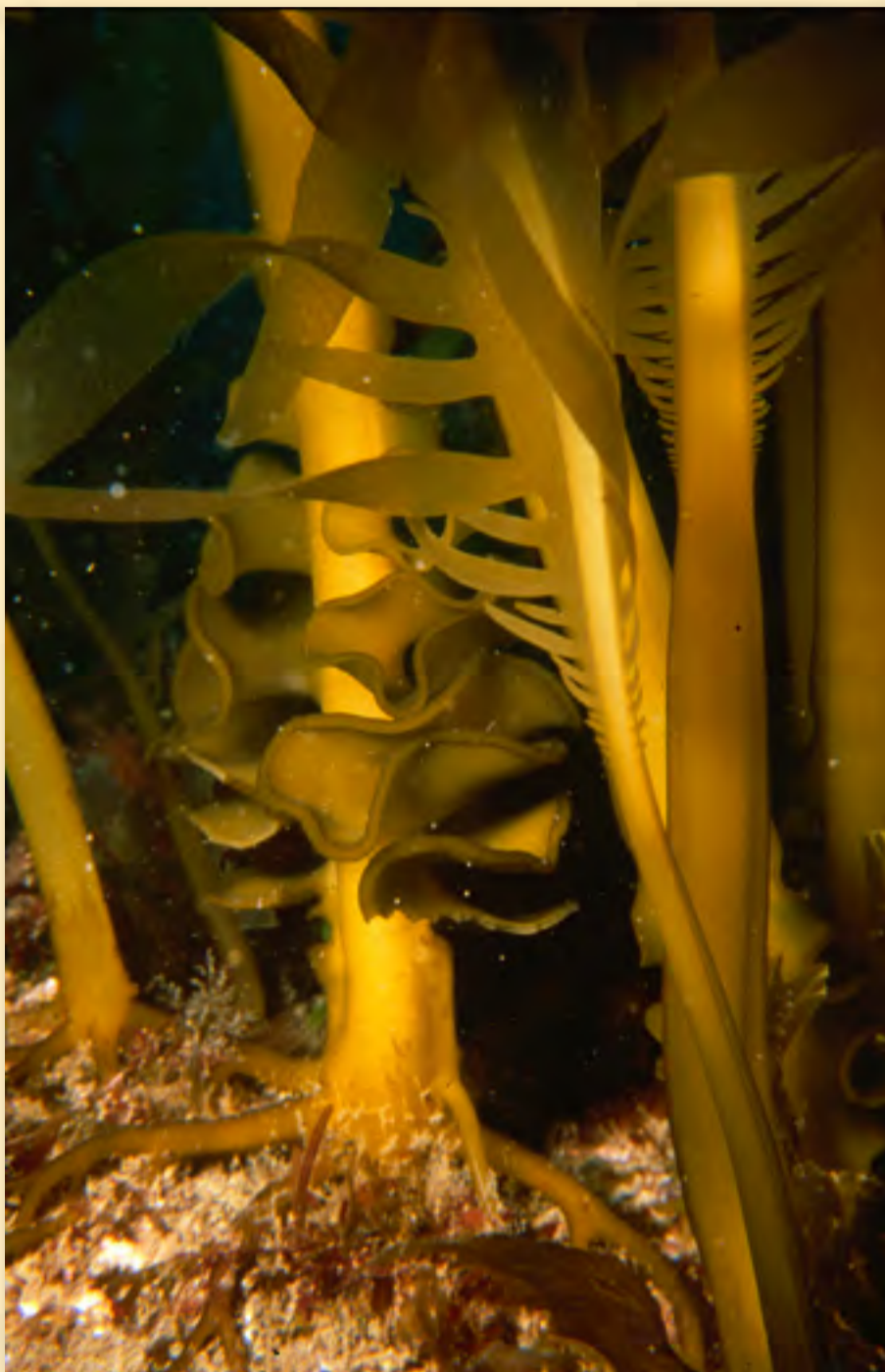
Alga Undaria pinnatifida .

A partir de 1992, un alga japonesa ( Undaria pinnatifida ) que fue accidentalmente traída por barcos pesqueros aparece en las costas de la Patagonia argentina causando problemas ambientales, sociales y económicos.