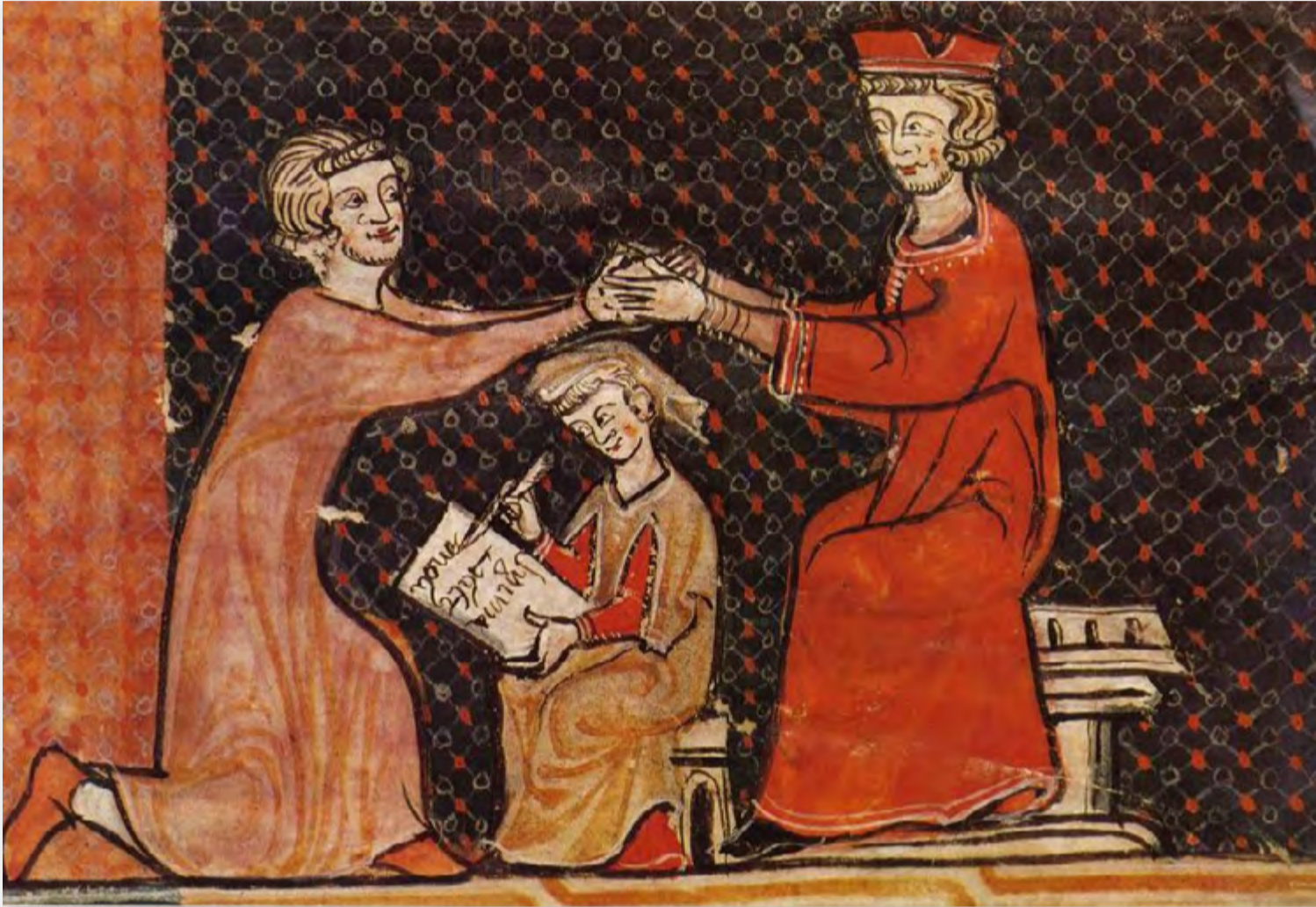
Miniatura de los Archivos Medievales de Perpignan, Francia.

d. Observen y analicen la siguiente imagen: