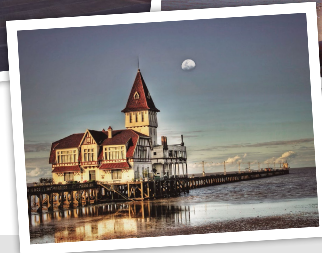
Club de Pescadores Buenos Aires, Costanera Norte.