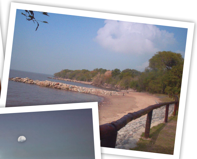
Reserva Ecológica, Costanera Sur.