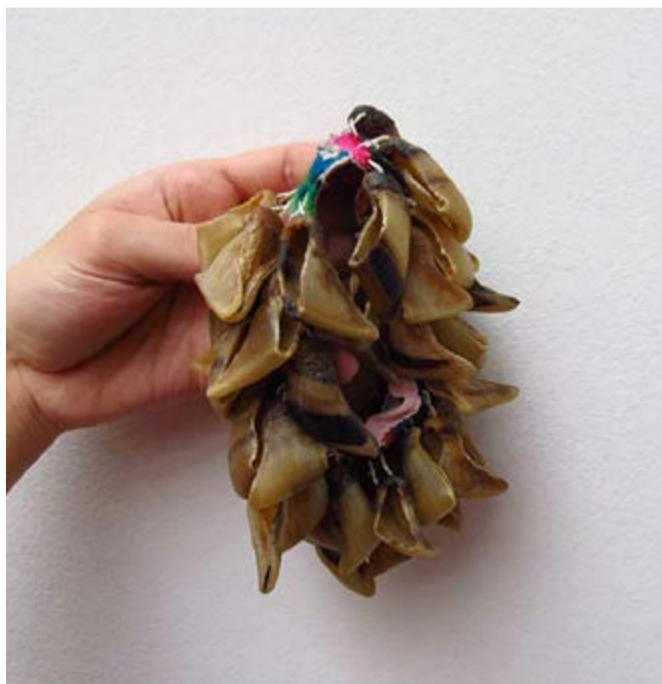
Imagen a. Sonajero de pezuñas.

En el video del canal PakaPaka: Toco con todos. Luthier (Sikus) podrán encontrar el proceso de construcción del siku.