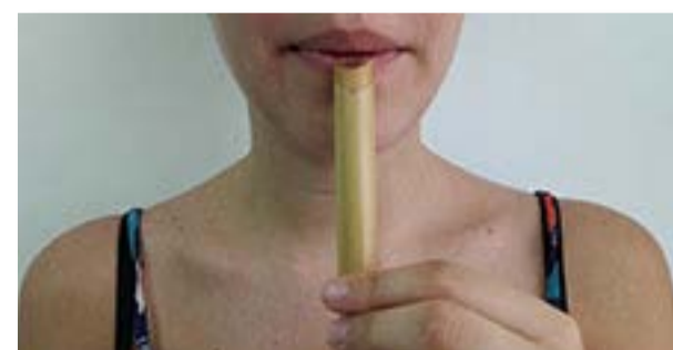
Imagen c. Forma de soplo.