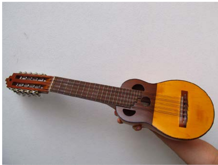
Imagen b. Charango.