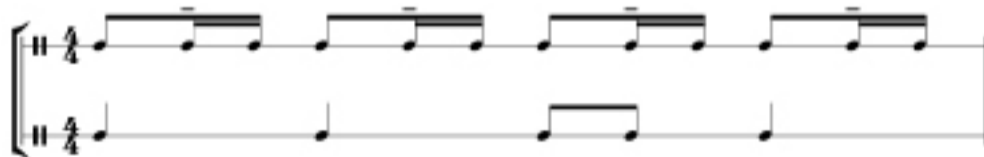
Ejemplo 3. Superposición de patrones básicos de huayno y carnavalito.

En el siguiente ejemplo se superponen dos ritmos; por lo tanto, el grupo debe subdividirse o pueden hacer el ritmo de la primera línea con palmas y el de la segunda línea, golpeando con los pies en el suelo.