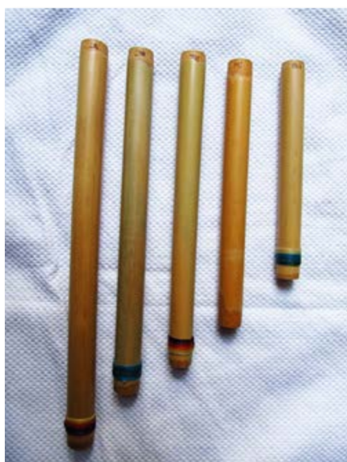
Imagen b. Tubos sueltos afinados en pentatonía.