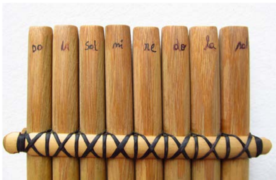
Imagen d. Así ve la antara el ejecutante.

Si observan con atención, tanto en la antara como en el siku la escala comienza con el sonido más grave de la fila (el tubo de la derecha, que tiene la nota sol). En los aerófonos andinos, los sonidos se ordenan al revés que en el piano o en el xilofón, es decir en forma opuesta. Como se ve en la fotografía, en la antara se repiten los sonidos sol, la y do en la octava superior o aguda (imagen d).