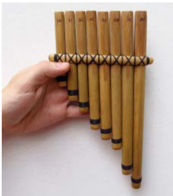
Imagen a. Antara.

Si “desarmamos” un siku o una antara (imagen a) y seleccionamos los tubos de caña que representan las notas de la escala pentatónica, podemos improvisar una melodía en forma grupal. Observen los tubos de caña sueltos: cada uno está afinado con un sonido diferente (imagen b). Los participantes se ubicarán en semicírculo, imitando la forma de la antara. El borde liso se apoya sobre el labio y el borde escotado va hacia afuera (imagen c). Se soplan los tubos naturalmente, como cuando sacamos sonido con el pico de una botella vacía o con el capuchón de una lapicera.