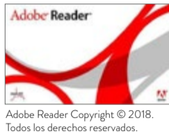
Adobe Reader Copyright © 2018. Todos los derechos reservados.

Para visualizar correctamente la interactividad se sugiere bajar el programa Adobe Acrobat Reader que constituye el estándar gratuito para ver e imprimir documentos PDF.