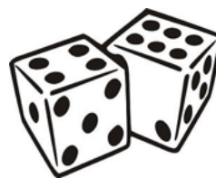
NO se puede avanzar