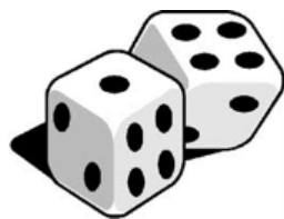
Se puede avanzar

c) En la variante I del juego hay algunas jugadas (combinaciones de dados) en las que se puede avanzar y otras en las que no. Por ejemplo: