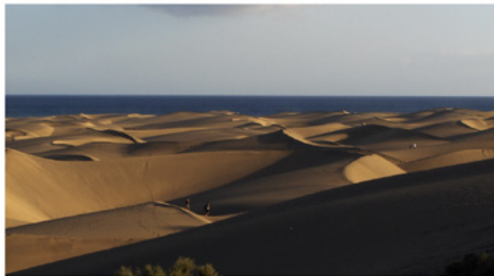
Figura 1: Dunas de Maspalomas, Islas Canarias.

Busquen en cualquier navegador de internet imágenes de dunas como las que se presentan abajo. Pueden escribir en el buscador: «dunas + geomorfología».