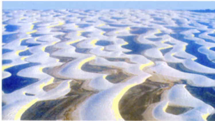
Figura 2: Foto aérea de un campo de dunas de tipo barján (parecidas a las de la zona estudiada). En la foto el viento predominante va de izquierda a derecha.