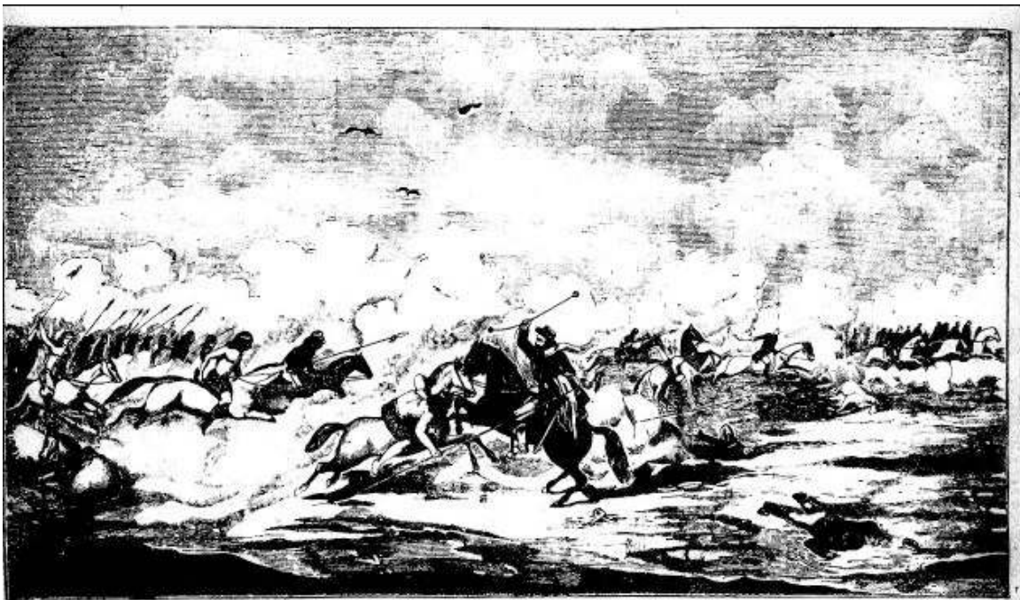
En el hijo de un cacique — siguió yo lo averigüé — la verdad del caso jué — que me tuve apuralazo — hasta que al fin de un balazo — del caballo lo bajé.

http://upload.wikimedia.org/wikipedia/commons/4/44/El_Gaucha_Mart%C3%ADn_Fierro_3.jpg