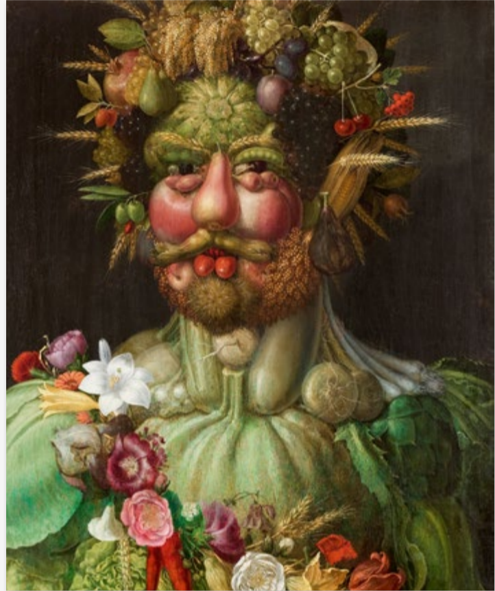
Retrato de Rodolfo II en traje de Vertumno, de Arcimboldo.