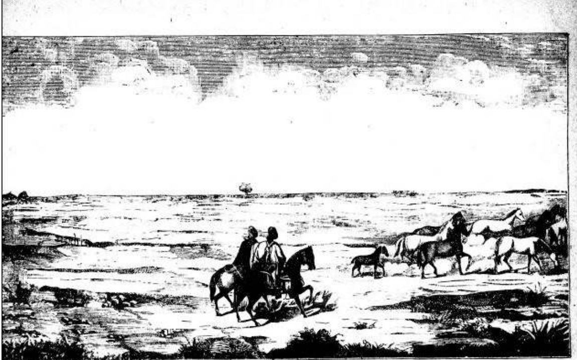
Por la ventana cruzaron — Y cuando la brisa pasó, — una madrugada clara — lo dijo Cruz que mirara — las últimas poblaciones...

http://upload.wikimedia.org/wikipedia/commons/4/44/El_Gaucha_Mart%C3%ADn_Fierro_3.jpg