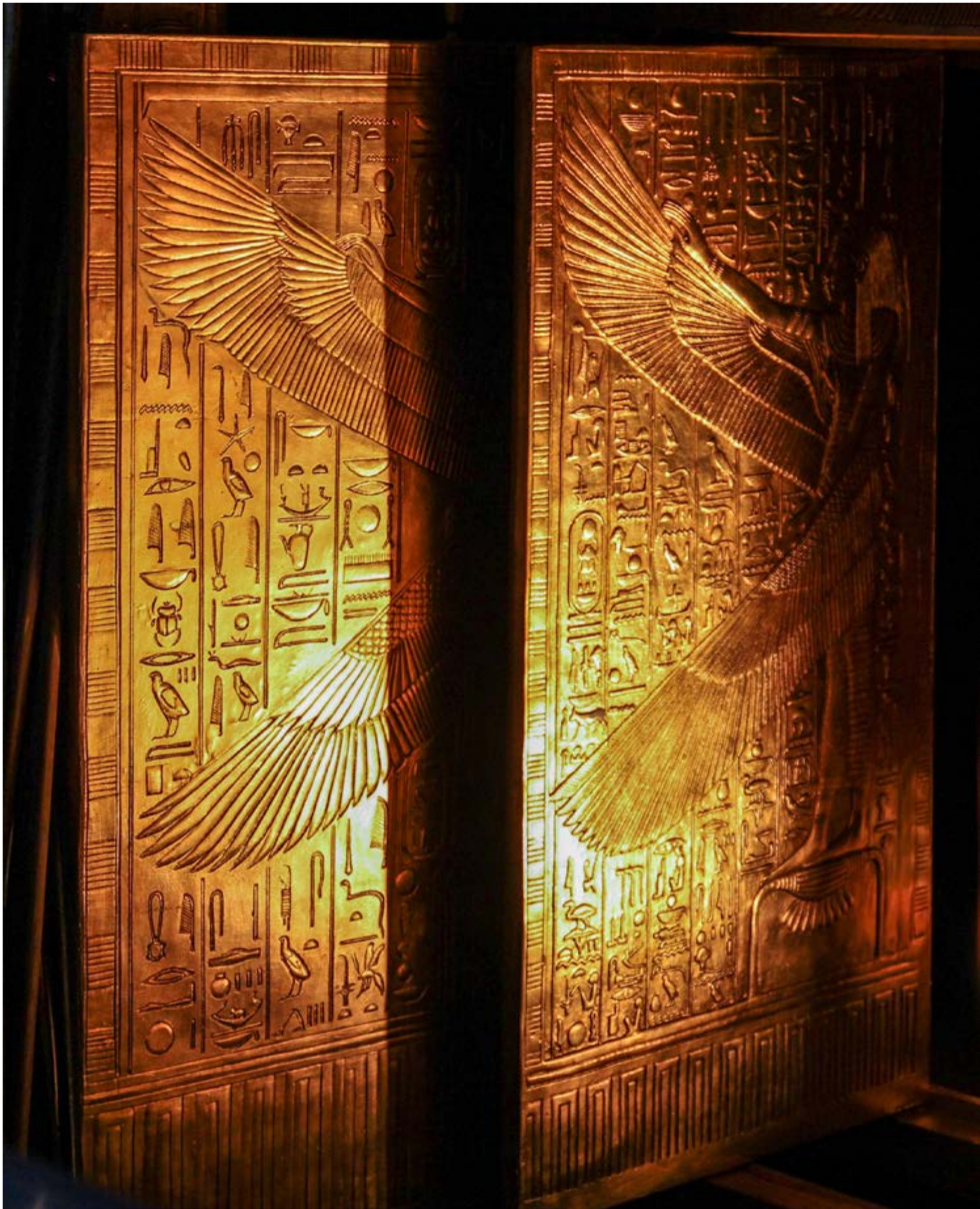
Puertas de oro halladas con los tesoros de la tumba de Tutankamón.